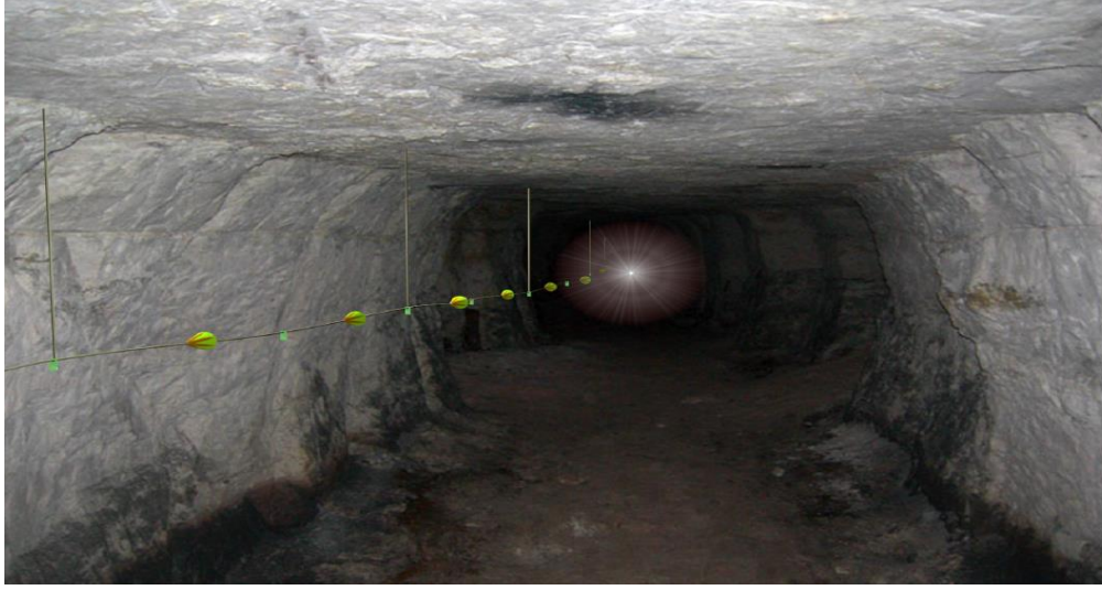
Şekil-Hata! Yer işareti tanımlanmamış.: Hayat hattı görünümü

18. (Ek:RG-10/3/2015-29291) (6) Yeraltı madenlerinde, hazırlık faaliyetlerinin yapıldığı alanlar ve üretim panoları gibi yeraltı maden işletmesinin bütün bölümlerini kapsayacak şekilde ve çalışanların yerüstüne çıkmalarını kolaylaştıran; yanmaya, kopmaya ve aşınmaya karşı dayanıklı bir hayat hattı kurulur (Şekil-1 ve Şekil-2). Bu hatlar acil durum planlarına uygun olarak yerleştirilir.